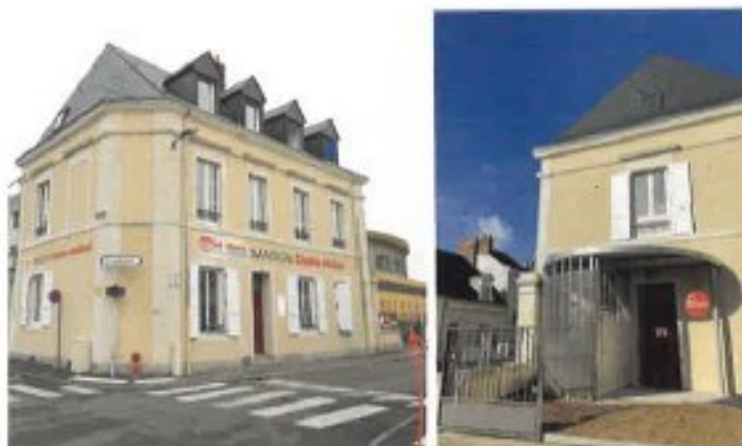
L'entrée se situe au niveau du portail à droite de la maison